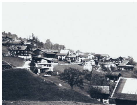
Hinterlauri, Quarten, undatiert

Die Verantwortung über die Termine liegt bei den Vereinen.