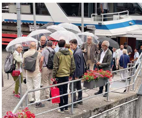
Ankunft Bundesrat in Quinten