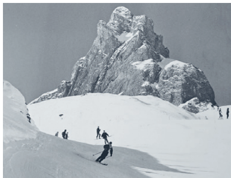
Sächsmoor Winter, undatiert

Die Verantwortung über die Termine liegt bei den Vereinen.